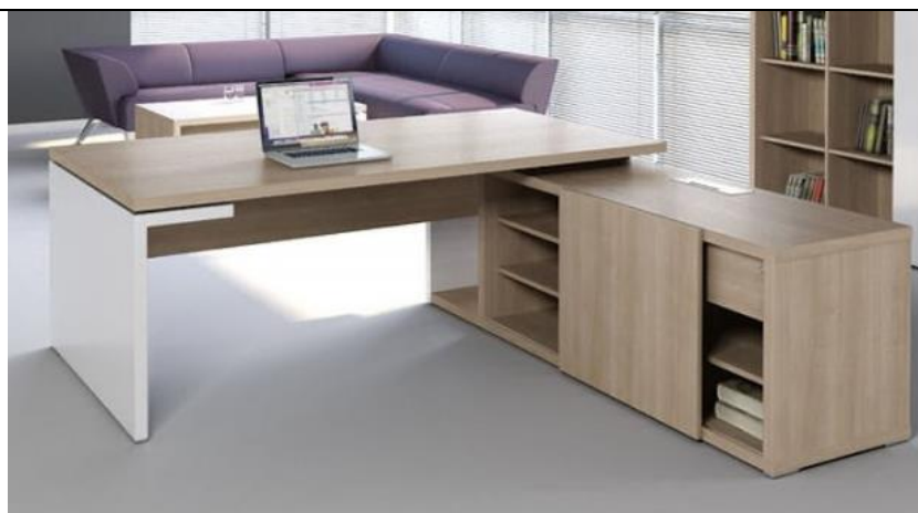
Imagine nr. 3