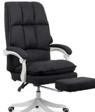
Scaun directorial textil cu suport de picioare OFF 426 negru