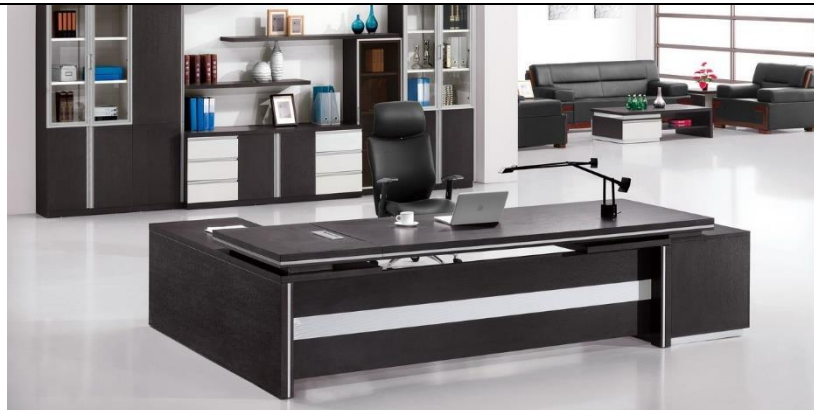
Imagine nr. 2