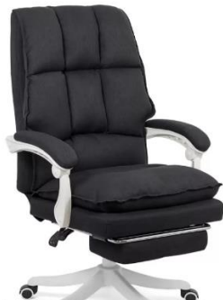
Scaun directorial textil cu suport de picioare OFF 426 negru