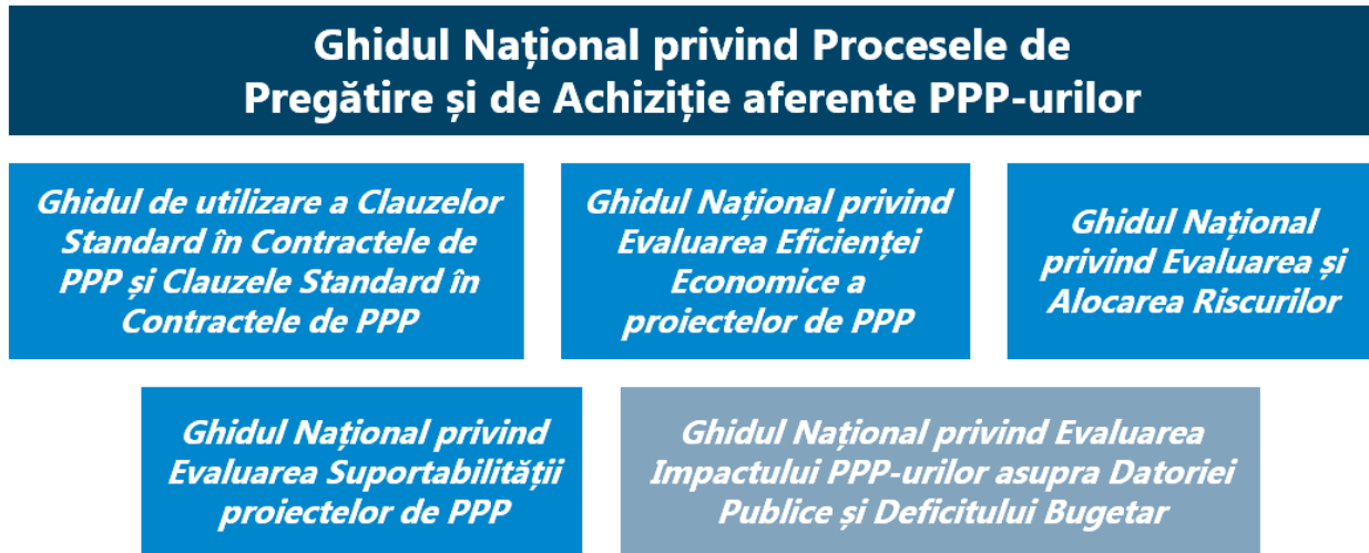
Figura 1: Documentația integrală care constituie Ghidului Național privind Pregătirea și Achiziționarea PPP-urilor

Prezentul ghid face parte din Ghidul Național privind Pregătirea și Achiziționarea PPP-urilor și trebuie citit în strânsă legătură cu procedurile și cu metodologia furnizate în setul de documente care fac parte din acest Ghid (a se vedea Figura 1).